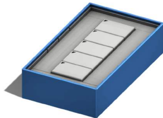
Empaque con 10 unidades de K+ | SmallBox.

*Configuración predeterminada en fábrica, con opciones de cambio al ordenar el dispositivo.