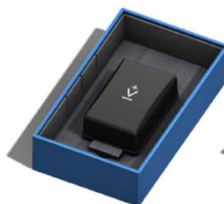
Empaque de una unidad K+ | RuggedBox